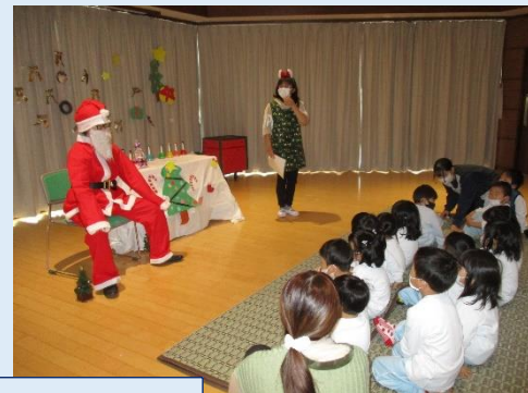
クリスマス会をしました